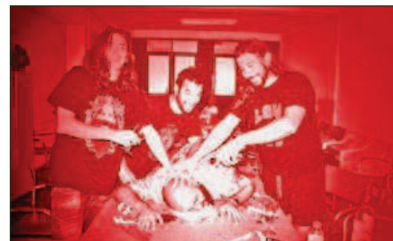
Burbujería

Publican: "Home Futile Home" [Autoeditado, 11] En la onda de: Julie Christmas, Amanda Palmer, Fiona Apple